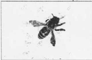
Die flügel-schlagende „animierte“ Biene ist dem Frommenhäuser Ortswappen entflohen

Teil drei unserer Serie Neues aus Rottenburg im Internet besucht die neue Homepage Frommenhausen. „Frumhusen“, so heißt es in der seit einigen Wochen abrufbaren online-Adresse, in Anspielung auf die urkundliche Ersterwähnung des Orts 1258. Begrüßt werden Besucher/innen auf der Homepage von der flügel-schlagenden „animierten“ Biene, die sich frech auf dem Geschriebenen niederläßt. Ein passendes Symbol, denn das Bienenlogo ist vom Ortswappen abgeleitet. Und auch sonst ist schön aufbereitete Abwechslung geboten. Aus privater Initiative ist die Homepage entstanden und bei der Erarbeitung des Inhalts kam von der Ortsverwaltung gute Unterstützung. „Frommenhausen im Internet“ versteht sich als Angebot, zu dem beizutragen alle EinwohnerInnen herzlich eingeladen sind. Grüß Gott heißt es auf dem Bildschirm zunächst mit dem Frommenhäuser Heimatlied. Übers Rathaus , Schulen, Kindergarten und Bücherei wird informiert, und Daten/Zahlen/Fakten läßt die örtlichen Ergebnisse der jüngsten Bundestagswahl erscheinen. Unter Heimatkunde findet sich Wissenswertes zum Ort und zu den Wagners von Frommenhausen. Die Kirchen stellen sich vor, die